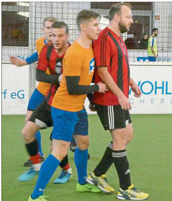
Spannendes Spiel: 2018 traten Volksbank und Bundeswehr gegeneinander an.